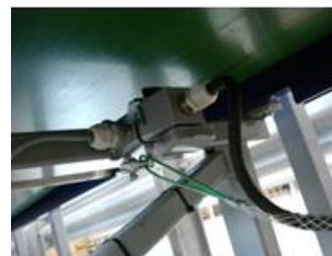
Trekontlasting op kabel